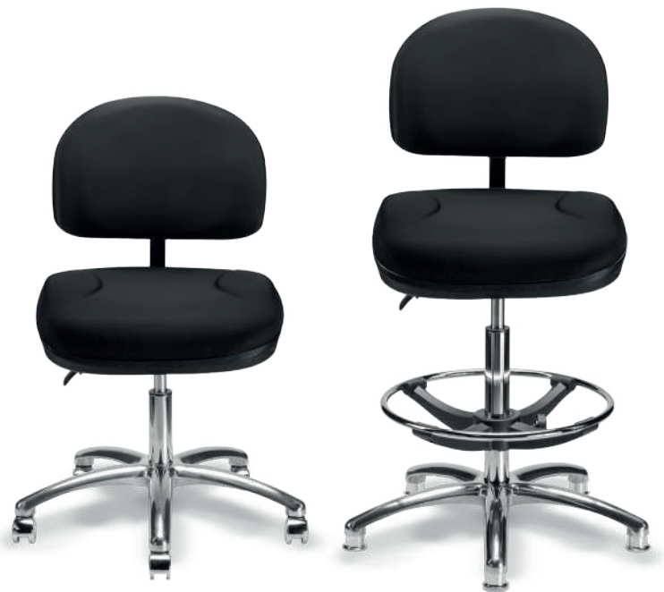
1932 B / 1932 A ESD Respaldo medio