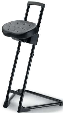
1915 Sit-Stand antifatiga

Poliuretano tipo piel integral. (color negro). Aro descansapies en modelo alto.