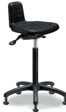
1917 A Sit-Stand antifatiga

Poliuretano tipo piel integral color negro, con giro lateral, ajustable en altura e inclinación.