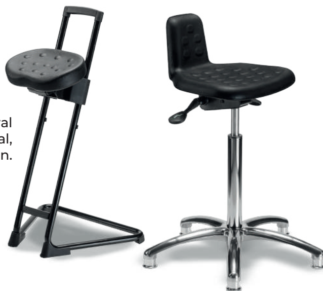
1918 A ESD Banco industrial ESD

1926 ESD Banco industrial ESD Poliuretano tipo piel integral color negro, con giro lateral, ajustable en altura e inclinación.