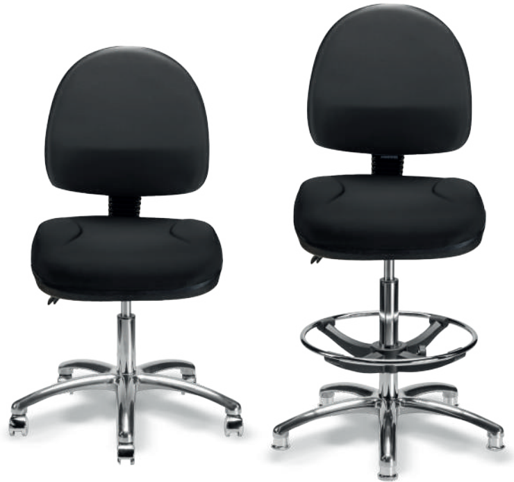
1942 B / 1942 A ESD Respaldo medio