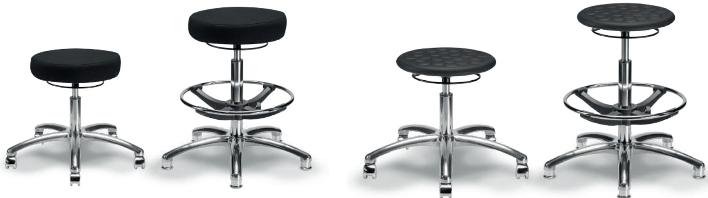
1907 B / 1907 A Banco industrial ESD

Giratoria, asiento y respaldo de poliuretano tipo piel integral (color negro), reclinable, con ajuste de altura de asiento y respaldo, aro descansapies. Coderas opcionales. Aro descansapies en modelo alto.