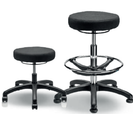
1905 B / 1905 A

Sillas de trabajo, industriales, comerciales, para laboratorio y electrostáticas ESD